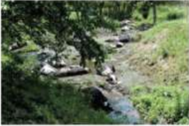
餓死した家畜の牛 2011年(船業町)