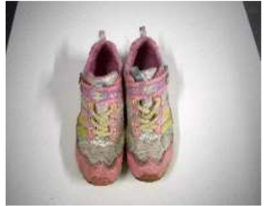
学校に取り残されたくつ