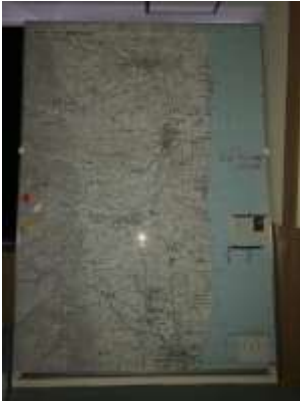
オフサイトセンター内に あった自衛隊地形図