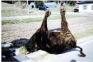
吊された牛の死骸 2011年6月27日(葛尾村)